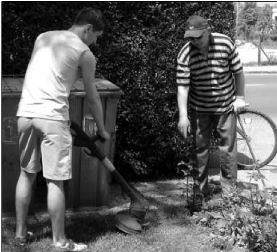
Dejavnost podjetja Libertas obsega tudi pomoč pri urejanju vrta

Podjetje Libertas lahko pokličete na pomoč 24 ur na dan in vse dni v letu, dosegljivi pa so na telefonskih številkah 01 721 94 54 in 031 872 286 .