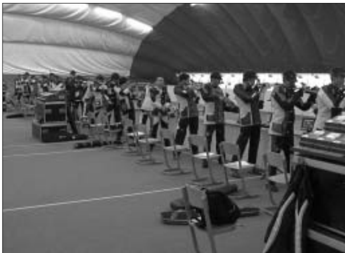
Tekmovalci na 12. Skirci Borisa Paternosta

Tudi pri 12. Skirci Borisa Paternosta so z nami sodelovali sponzorji, ki so z reklamiranjem pomagali pri organizaciji tekmovanj. Brez slednjih je izvedba nemogoča,