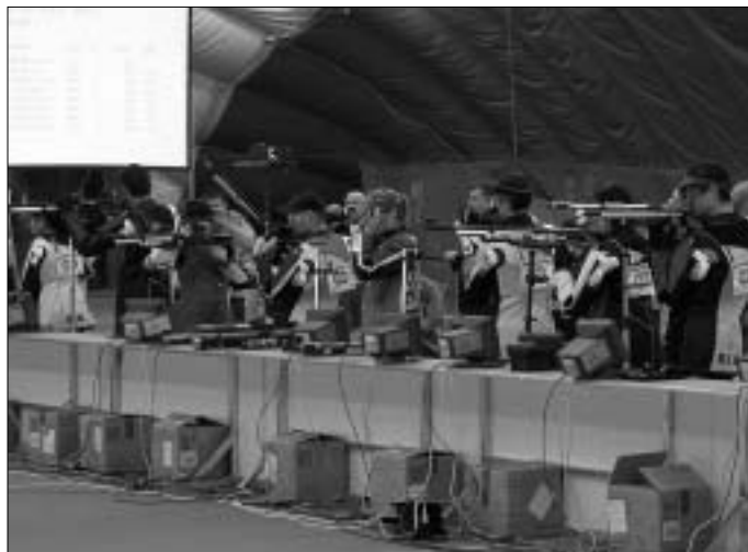
Strelci v superfinalu

strelcev, medtem ko je bila nedeljska udeležba resnično mednarodna, saj je nastopilo kar 204 tekmovalcev, od tega 54 strelcev iz sosednje Hrvaške, 8 iz Italije, 3 iz Bosne in Hercegovine ter 2 iz Srbije.