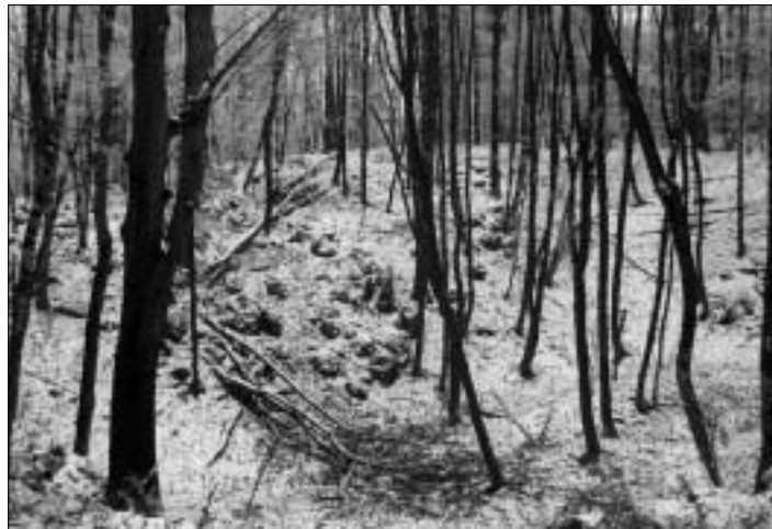
Čaroben in skrivnosten gozd na Ongru, odet v ivje, nam je večkrat popestril minule, sicer mrzle in sive, božično-novoletne praznike.