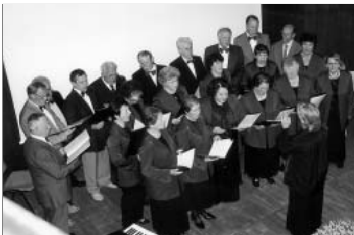
V zboru danes primanjkuje predvsem moških glasov, zato vabijo vse, ki radi pojejo, naj se jim pridružijo.

Pet let sicer ni tako dolgo obdobje, a vseeno dovolj, da se je na vajah in nastopih pripetilo tudi marsikaj zanimivega, tudi smešnega. »Dobro se spominjam nekega nastopa, še bolj na začetku našega delovanja je bilo, ko smo naenkrat vsi pevci kar sredi pesmi prenehali peti. Še danes ne vem, zakaj. Zborovodkinja je sicer dirigirala in tudi besedilo pesmi smo imeli kot po navadi vsi pred seboj, mi pa smo kar utihnil. Še dobro, da je na koncu izpadlo tako, da so poslušalci mislili, da je pesmi pač konec in da smo, ko smo v resnici z njo čez nekaj trenutkov nadaljevali, vsi mislili, da smo začeli z novo pesmijo.«