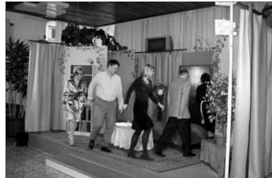
Predstava Jožef in Marija ali Popoldanska šola za žene.

Skozi vso predstavo se ti spontano vsiljuje primerjava: na eni strani majhna vasica v odročnem kraju, daleč od kulturnega centra, z več kot skromnimi razmerami, saj razpolagajo v starih grajskih prostorih z majhnim odrom, z nikakršnimi tehničnimi pripomočki (imajo vsega tri reflektorje), pa vendar jim ljubiteljska zagnanost daje polet, da ne samo igrajo na domačem