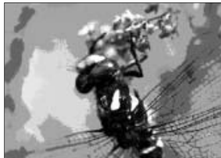
Veliki studenčar ( Cordulegaster heros )

V bližini naselja Mlake se lahko ustavimo ob zanimivem poplavnem gozdu, ki ga sestavljajo jelše, jeseni in vrbe. Spomladi moramo biti kar previdni, da ne pohodimo kakšne od številnih žab, ki so na poti do svojih mrestišč. V plitki vodi jarka ob gozdni cesti lahko opazujemo njihove paglavce, pozorno oko pa lahko zasledi tudi ličinke kačjih pastirjev. Na območju Rašice živi največji slovenski kačji pastir, veliki studenčar, ki najde zatočišče v manjših potokih in jarkih, v katerih lahko njegove ličinke preživijo celo krajša sušna obdobja. Naravnih zakladov Rašice pa s tem še zdaleč ni konec. Ste že slišali za lepi čevljič? To je orhideja z velikimi rumeno vijoličnimi cvetovi, ki uspeva v iglastih gozdovih. V Evropi je ogrožena, zato je pomembno, da jo ohranimo. Če jo opazite med svojim sprehodom, si jo oglejte, a pustite jo rasti v svojem naravnem okolju. Trganje cvetov ali izkopavanje gomoljev lepega čevljiča bi lahko pomenilo izumrtje vrste na območju Rašice.