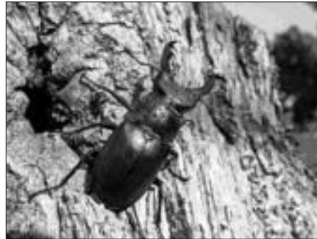
Rogač ( Lucanus cervus )

li na podrto drevo, ki so ga že porasle glivice, se lahko zamislite - je to konec ali nov začetek?