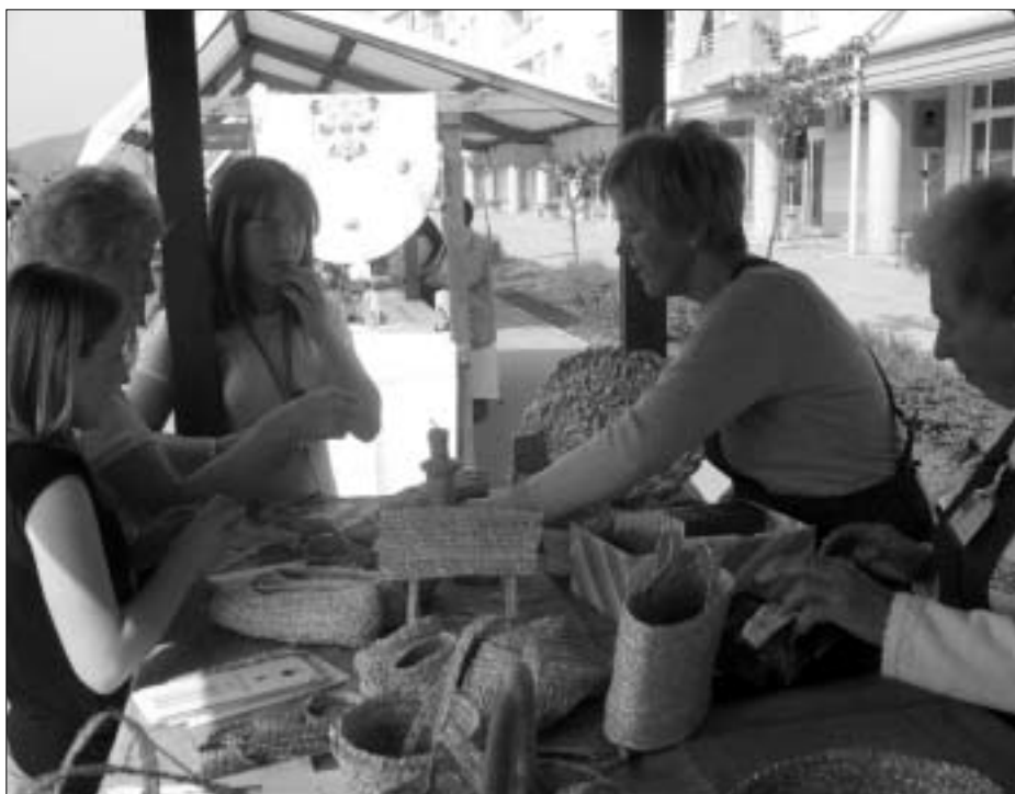
Sejemske stojnice so bile zanimive za staro in mlado. Največ pozornosti so pritegnili izdelovalci domače in umetnostne obrti, tudi članice KUD-a Frana Maslja Podlimbarskega iz Krašnje, ki so pletle kite in šivale izdelke iz njih.