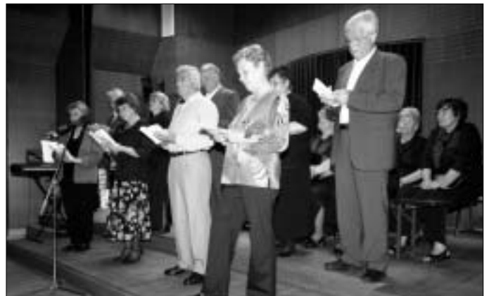
Recitatorsko skupino Žerjavčki večkrat vabijo v goste.