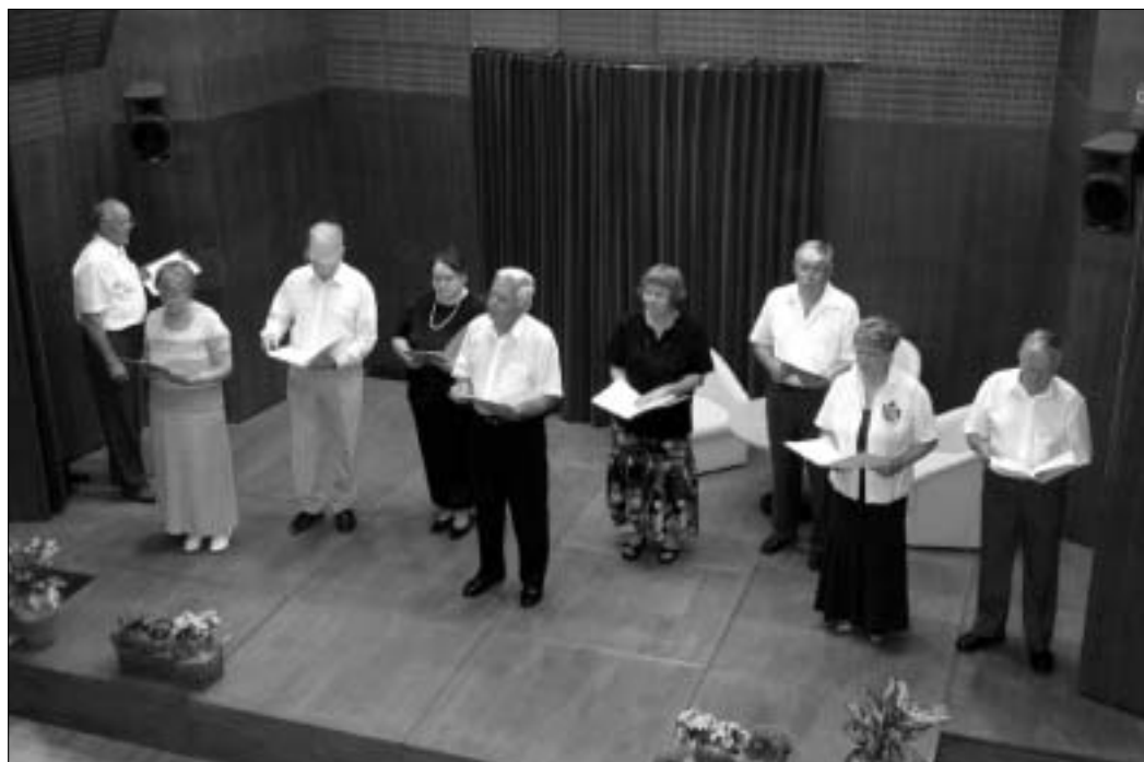
Trzinski upokojenci na svojem drugem recitalu poezije