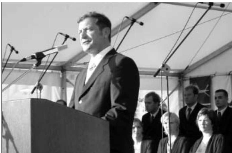
Slavnostni govornik minister za obrambo Karl Erjavec

pravljene žrtvovati svoja življenja in srečno prihodnost svojih družin.