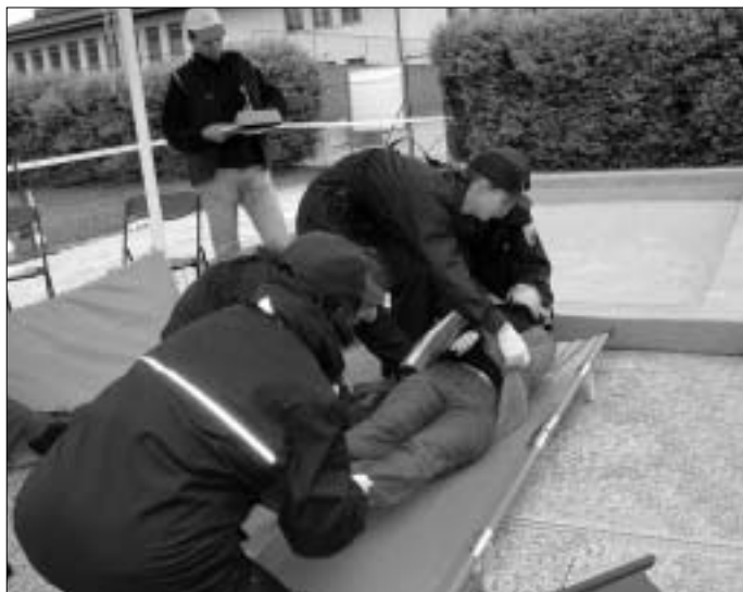
Gospo v uniformi so bile zelo urne.

Zakon o varstvu pred naravnimi in drugimi nesrečami v 76. členu opredeljuje enote in službe civilne zaščite, med njimi tudi enote za prvo pomoč. Prva pomoč je neposredna zdravstvena oskrba, ki jo dobi poškodovanec ali nenadno zboleli na kraju dogodka in čim prej po njem ter je opravljena s preprostimi pripomočki in z improvizacijo. Pri prvi pomoči je treba ukrepati naglo, pravilno in v pravem zaporedju. Laična prva pomoč traja toliko časa, dokler ne pride strokovna pomoč.