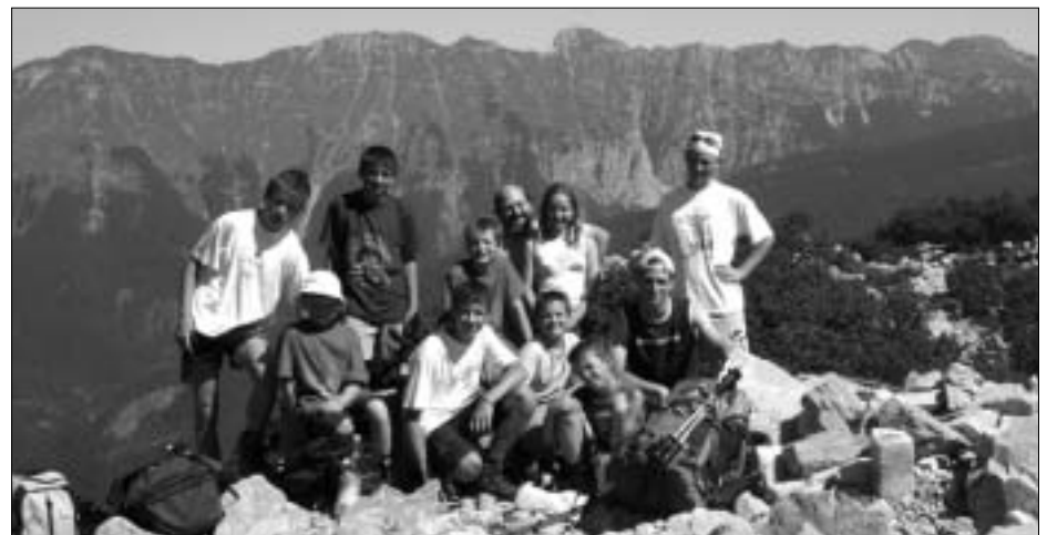
Starejši na vrhu Stegovnika, v ozadju greben Košute. Na Stegovnik iz Medvodja ne vodi markirana pot.

Seveda pa v naslednjih tednih (in mesecih) lahko pričakujete še nekaj »posladkov s tabora«: »WC cajtnj« je že začel izhajati »on-line« (prepričajte se na naši spletni strani), CD s tabornimi fotografijami, taborni časopis B.N. (Brezmejna Navkreberlazenja), predstavitev našega dela ob tednu otroka, če pa bo imela »sreča mlade«, se zna zgoditi, da boste tam nekje v decembru ugledali vabila, ki bodo vabila na »Pregled skozi dve desetletji mladinskih planinskih taborov«.